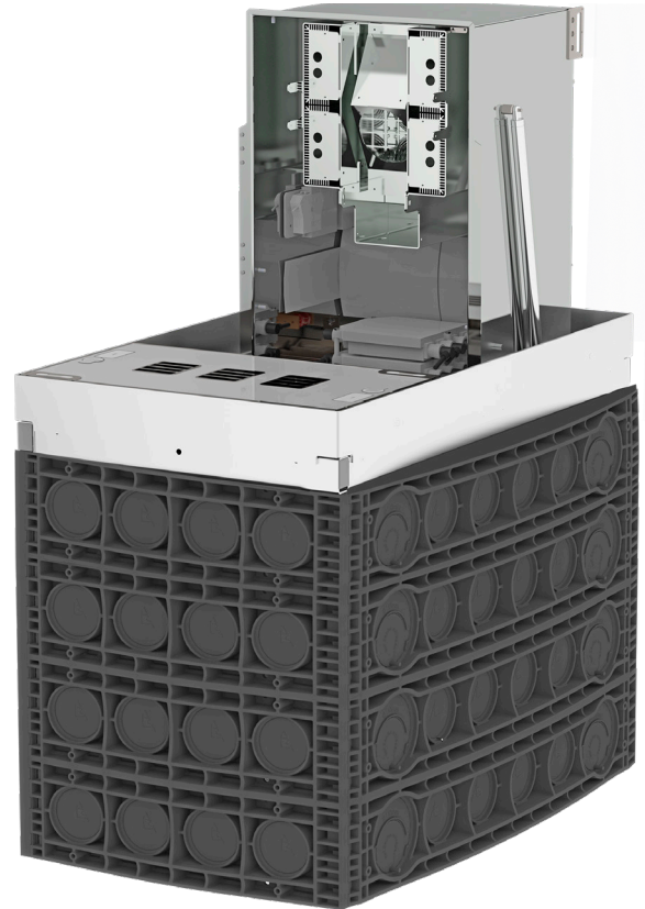
▲ EK890 Unterflurverteiler mit geöffneter Abdeckung und Tauchhaube