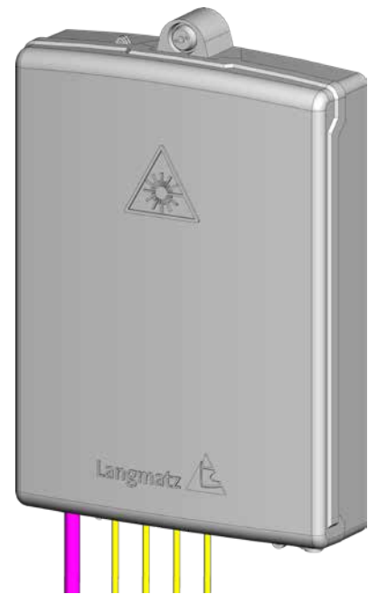
▲ Gf-AP Gr. M geschlossen