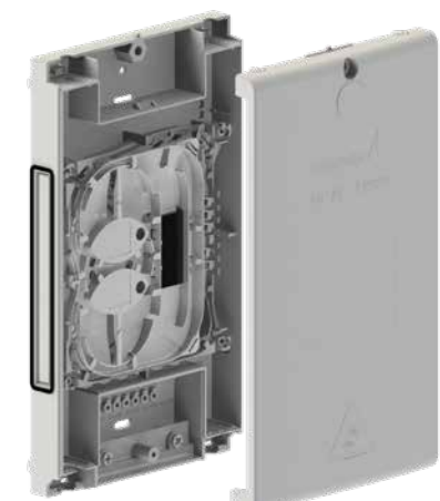
▲ Gf-AP M+ 3.0 mit Abdeckung