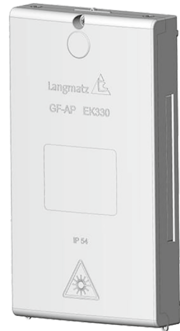
▲ Gf-AP M+ 3.0 geschlossen