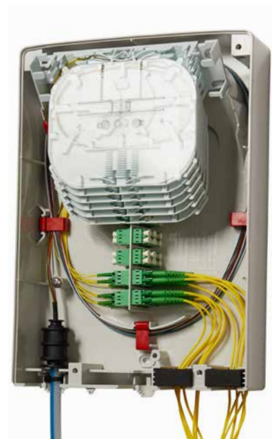
▲ Gf-AP L 3.0 geöffnet