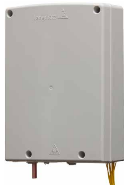
▲ Gf-AP L 3.0 geschlossen